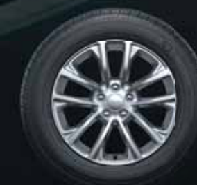
17-дюймовые легкосплавные диски в базовой комплектации