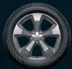
18-дюймовые легкосплавные диски в базовой комплектации