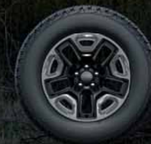
17-дюймовые легкосплавные диски в базовой комплектации