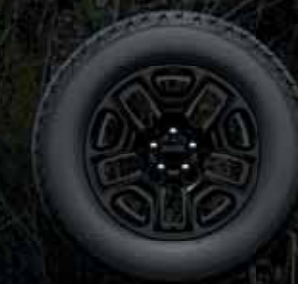
В качестве опции предлагаются 17-дюймовые легкосплавные диски черного цвета