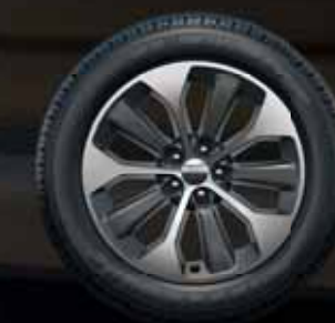
19-дюймовые легкосплавные диски в базовой комплектации